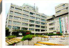
● 品川区役所 本庁舎